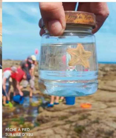
PÊCHE À PIED SUR L'ÎLE D'YEU