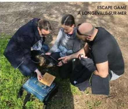
ESCAPE GAME À LONGEVILLE-SUR-MER