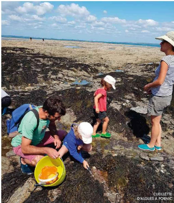
CUEILLETTE D'ALGUES À PORNIC