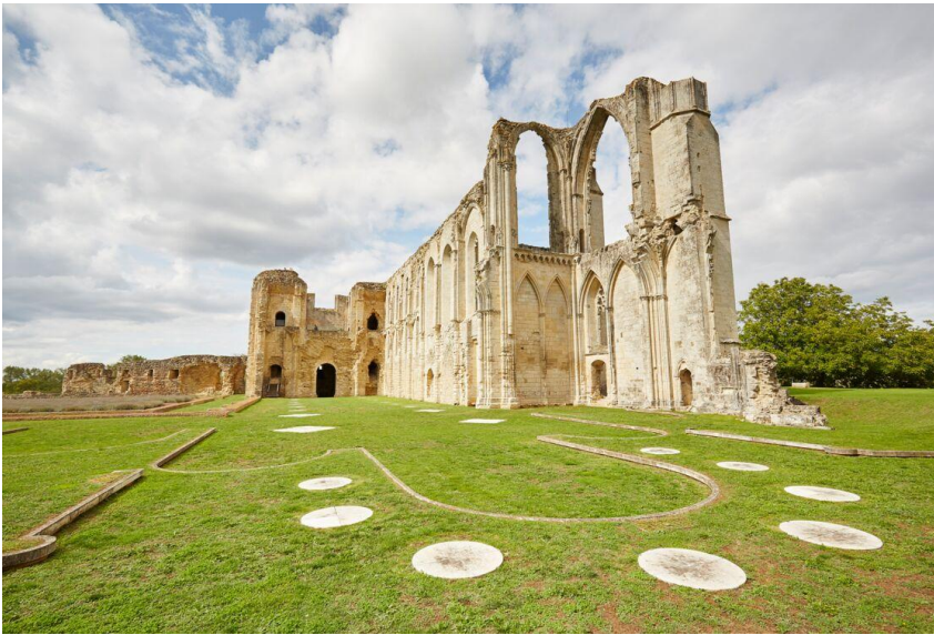
L'abbaye de Maillezais.